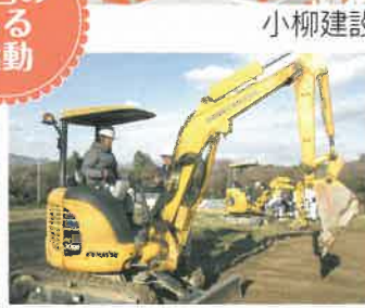
小型車両系建設機械特別講習