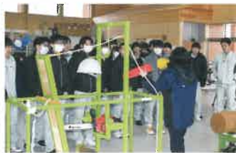
福島県林業アカデミー