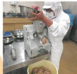
味噌製造大豆破砕

卒業後は食品製造および流通業・販売などの関連産業の技術者、従事者等を目指します。