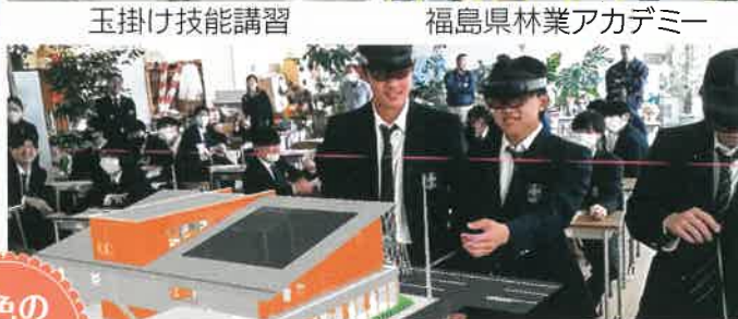
小柳建設出前授業