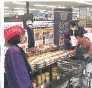
お弁当マルト中岡店販売会