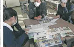
パンフレット作成