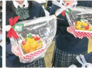
フルーツアート講習