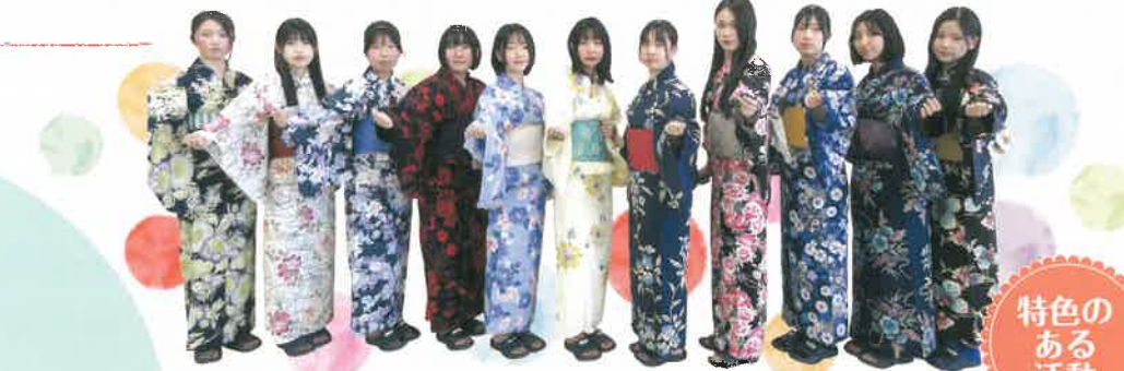
被服製作技術検定和服1級

農業、被服、食物、保育、福祉などの知識・技術を学びます。調理師や栄養士、保育士や幼稚園教諭、介護福祉士、看護師などを目指し、各種資格に挑戦できます。