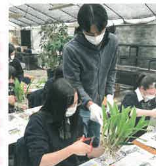
カトリア植替え実習