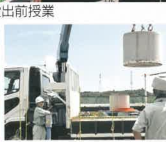
移動式クレーン運転特別教育