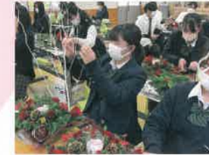
フラワーアレンジメント講習