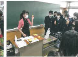
フルーツアート実習