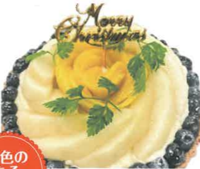
タルトケーキの製造