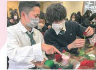
フラワーアレンジメント実習