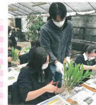
カトリア植替え実習