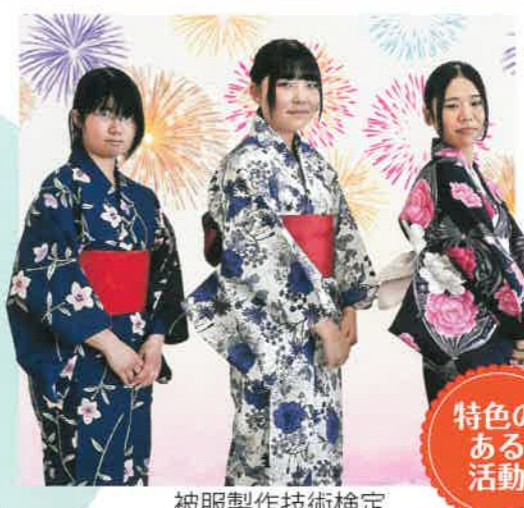
被服製作技術検定

農業、被服、食物、保育、福祉などの知識や技術を学びます。調理師や栄養士、保育士や幼稚園教諭、介護福祉士、看護師などをめし、各種資格に挑戦できます。