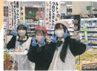
さつまいもジャム試食販売会