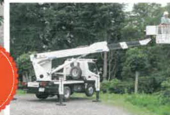
高所作業車運転特別教育