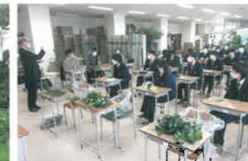
森林環境学習会(講師:東京農業大学教授)