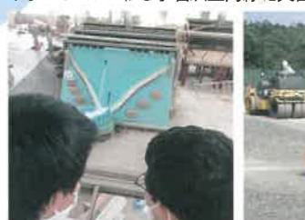
筑波土木研究所見学