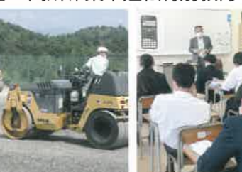
締固め機械(ローラー)運転特別教育