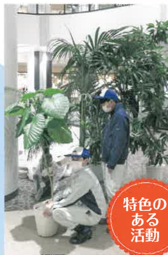
イオンモールいわき小名浜室内緑化実習

環境保全と緑化に重点をおいた新しい土木技術と、橋や道路・庭園など、仕事に形となって残る「ものづくり」の知識・技術を学び、新しい時代の土木・造園技術者の育成を目指します。