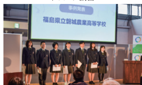
先端技術体感フェアでの事例発表