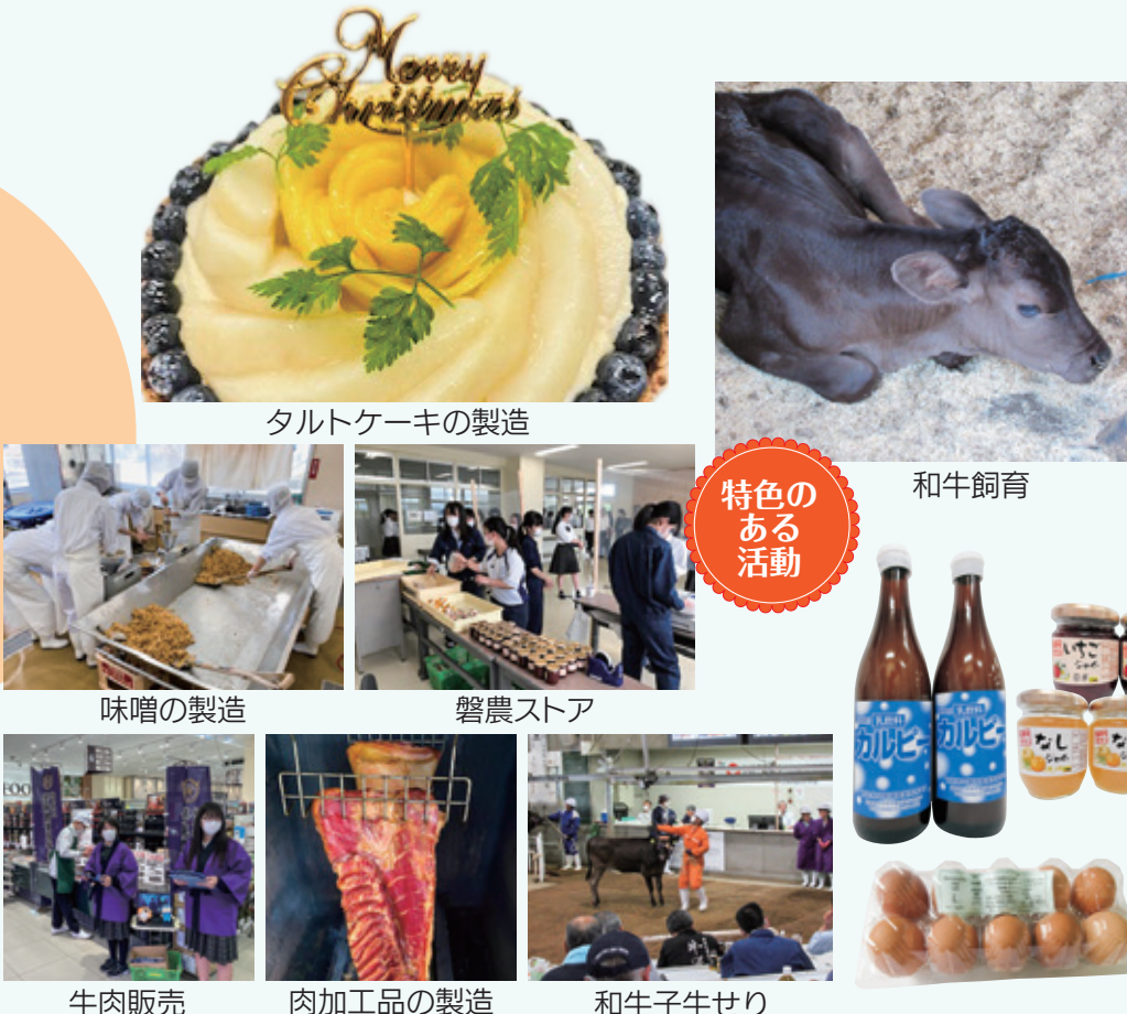
タルトケーキの製造

食品流通の基礎的知識から食品の加工・製造、家畜の飼育などを学びます。卒業後は食品製造および流通業・販売などの関連産業の技術者、従事者等を目指します。