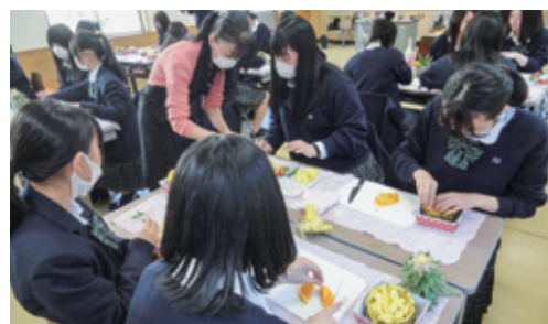
フルーツアート実技講習